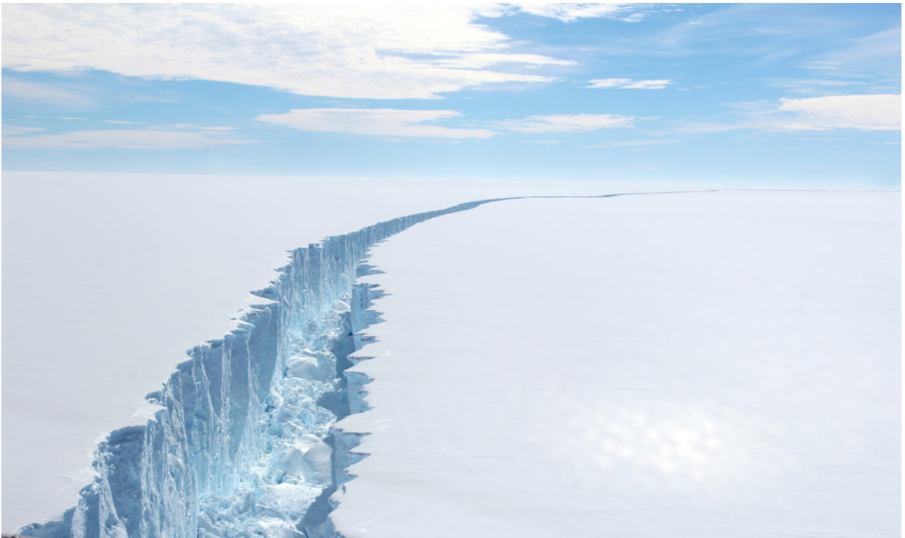
Gigantischer Riss im Larsen-C-Schelfeis in der Antarktis