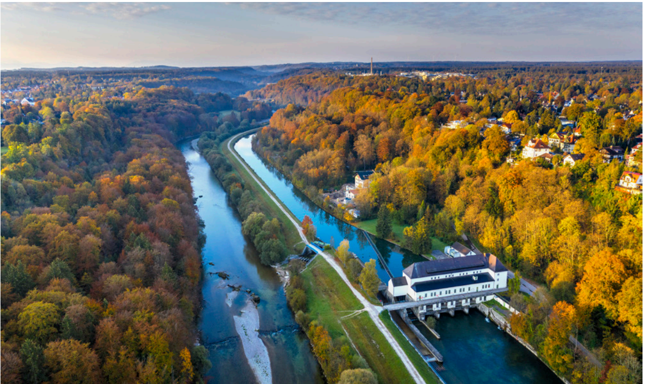
Wasserkraftwerk Pullach, Isar und Isarkanal