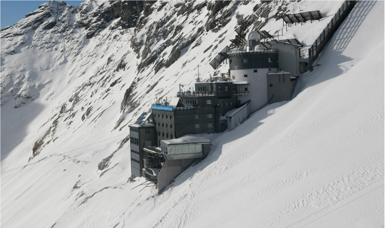
Umweltforschungsstation Schneefernerhaus auf der Zugspitze