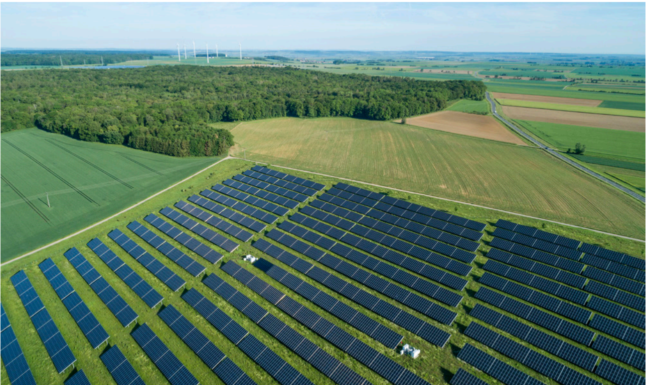
Solarpark bei Stalldorf in Unterfranken