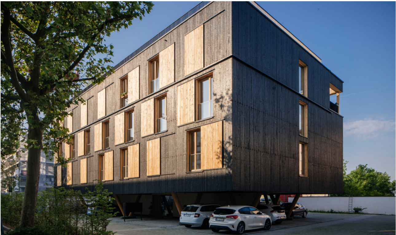
Das „Haus auf Stelzen“ – Holzwohngebäude der Bayerischen Staatsforsten in Regensburg

Wir müssen sensibilisieren und klarmachen: Nicht endlos duschen, sondern Wasser vernünftig und mit Verstand nutzen. Der schonende Umgang mit den wertvollsten Ressourcen ist wichtiger Leitmaßstab für die Zukunft.