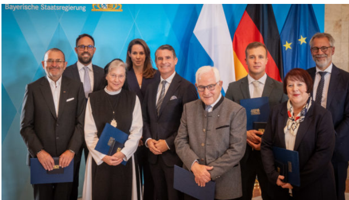
Verleihung der Europa-Medaille 2025