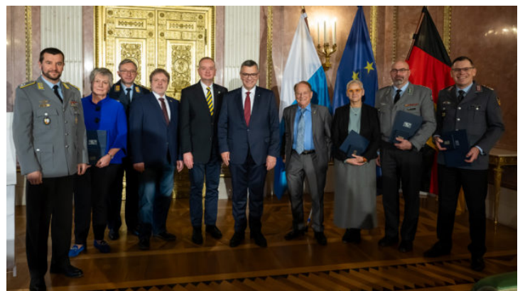
Verleihung der Medaille für Verdienste um die Zivil-Militärische ...