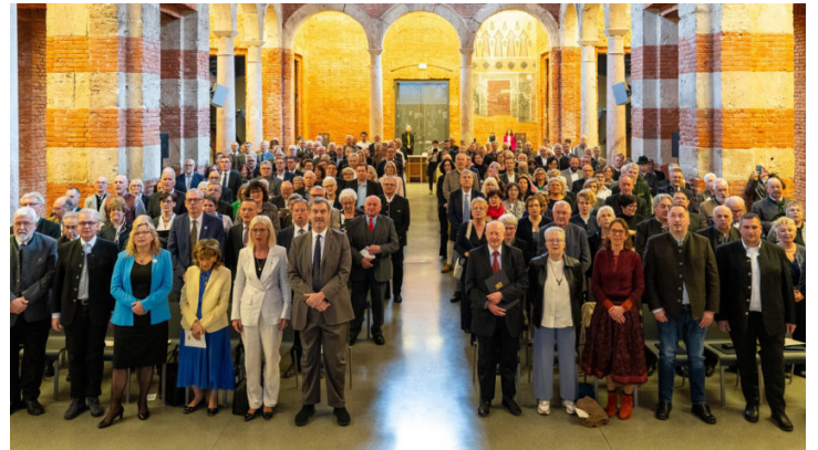
Verleihung des Ehrenzeichens für Verdienste im Ehrenamt 2026 ...