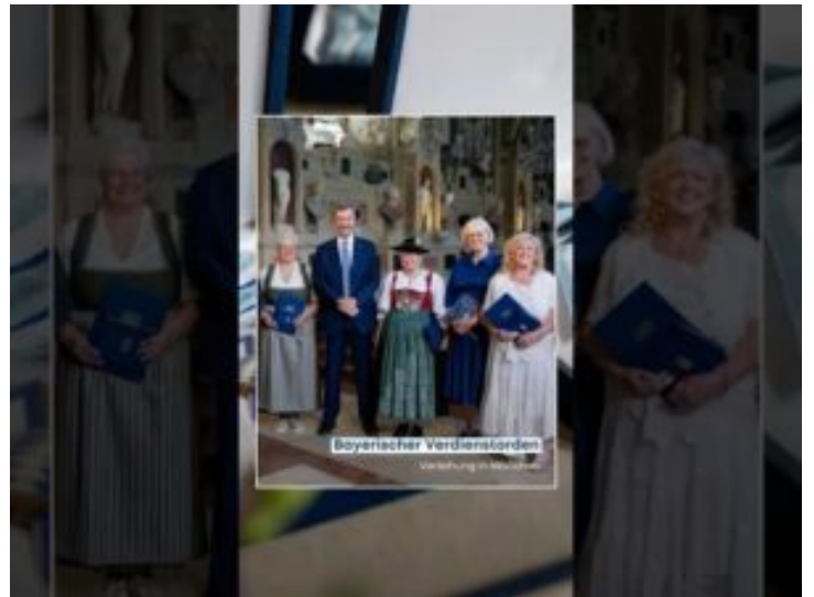
Verleihung des Bayerischen Verdienstordens 2025 – Bayern ...