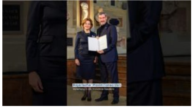
Verleihung des Bayerischen Maximiliansordens 2025 – Bayern ...