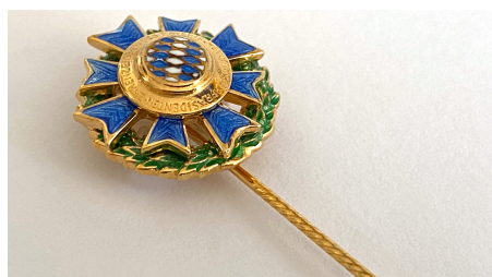
Ehrenzeichen des Bayerischen Ministerpräsidenten für Verdienste im Auslandseinsatz.

Das Ehrenzeichen des Bayerischen Ministerpräsidenten für Verdienste im Ehrenamt wird seit 1994 als ehrende Anerkennung für langjährige hervorragende ehrenamtliche Tätigkeit verliehen. Der Ministerpräsident verleiht sein Ehrenzeichen an Personen, die sich mit ihrer aktiven Arbeit in Vereinen, Organisationen und sonstigen Gemeinschaften mit kulturellen, sportlichen, sozialen oder anderen gemeinnützigen Zielen hervorragende Verdienste erworben haben – vorrangig im örtlichen Bereich und seit mindestens 15 Jahren.