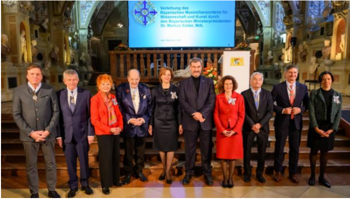
Bayerischer Maximiliansorden 2025