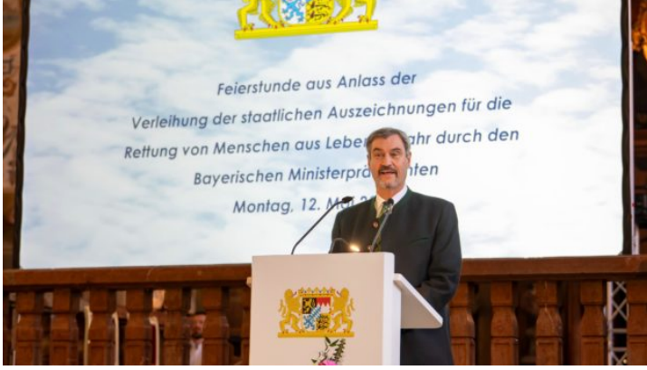
Bayerische Rettungsmedaille & Christophorus-Medaille 2025 ...