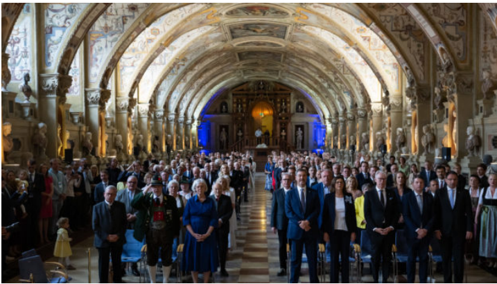
Bayerischer Verdienstorden 2025