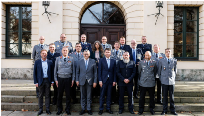
Aushändigung des Ehrenzeichens für Verdienste im Auslandseinsatz ...