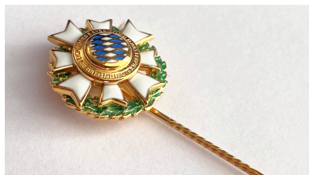
Ehrenzeichen des Bayerischen Ministerpräsidenten für Verdienste im Ehrenamt.

Das Ehrenzeichen des Bayerischen Ministerpräsidenten für Verdienste im Ehrenamt wird seit 1994 als ehrende Anerkennung für langjährige hervorragende ehrenamtliche Tätigkeit verliehen. Der Ministerpräsident verleiht sein Ehrenzeichen an Personen, die sich mit ihrer aktiven Arbeit in Vereinen, Organisationen und sonstigen Gemeinschaften mit kulturellen, sportlichen, sozialen oder anderen gemeinnützigen Zielen hervorragende Verdienste erworben haben – vorrangig im örtlichen Bereich und seit mindestens 15 Jahren.