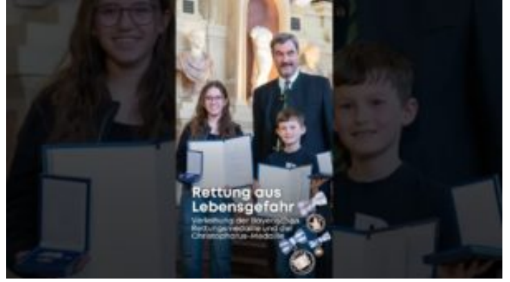
Großer Dank an Bayerns Lebensretterinnen und Lebensretter! ...