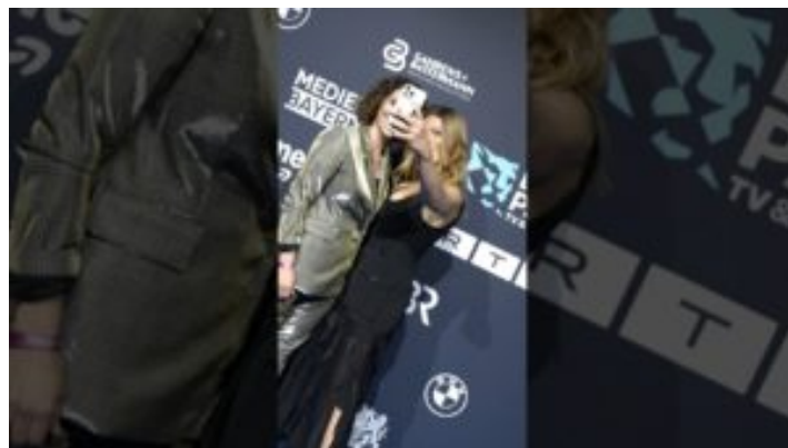
Blauer Panther – TV & Streaming Award 2025