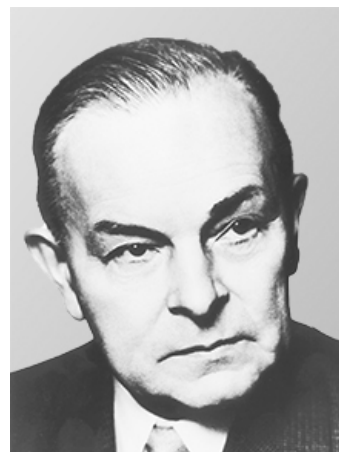
Dr. Hans Ehard