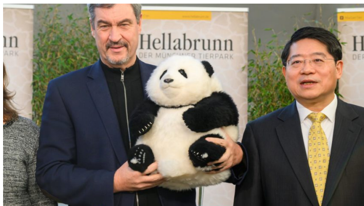
Pandas für den Tierpark Hellabrunn