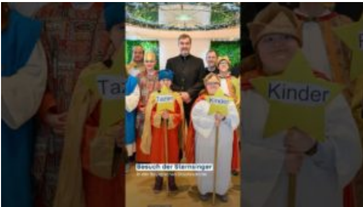
Sternsingeraktion 2026 – Bayern