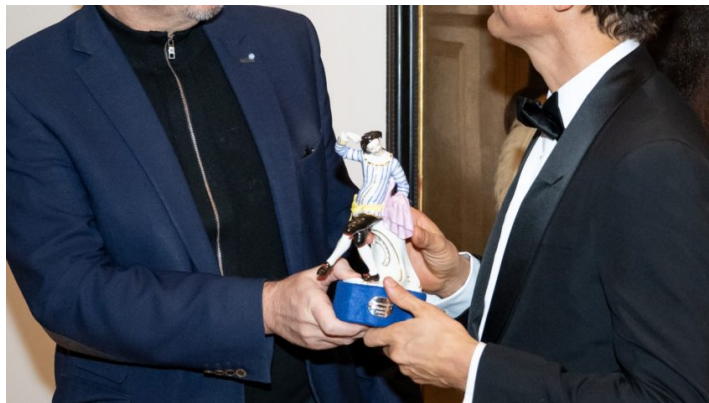
Ehrenpreis des Ministerpräsidenten beim Bayerischen Filmpreis ...