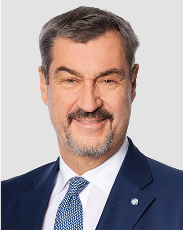
Porträt: Dr. Markus Söder, MdL

Geboren am 5. Januar 1967 in Nürnberg, verheiratet, vier Kinder