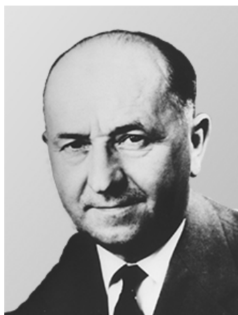
Dr. Hanns Seidel