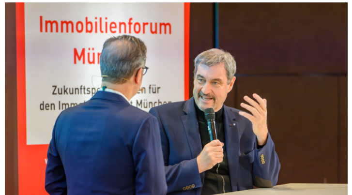
17. Immobilienforum München