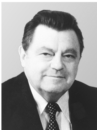
Dr. h. c. Franz Josef Strauß