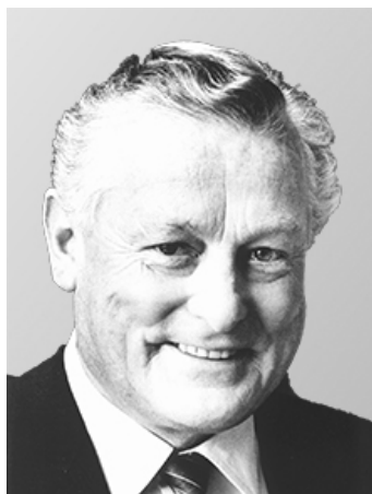
Dr. h. c. Max Streibl