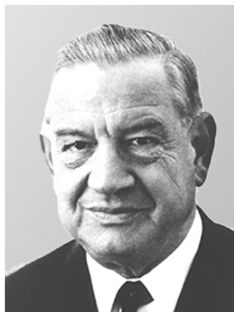
Dr. h. c. Alfons Goppel