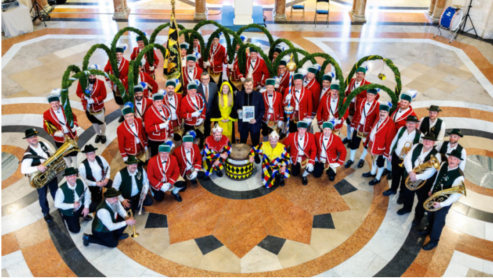
Traditioneller Schafflertanz im Kuppelsaal