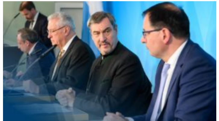
Video in Gebärdensprache: Pressekonferenz nach der Kabinettsitzung ...