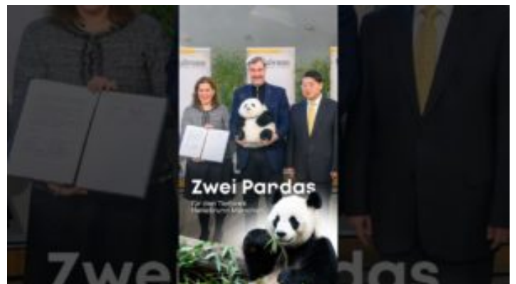
Panda-Pärchen für den Tierpark Hellabrunn – Bayern