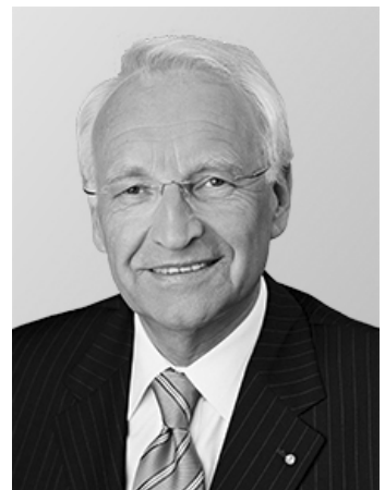
Dr. Edmund Stoiber