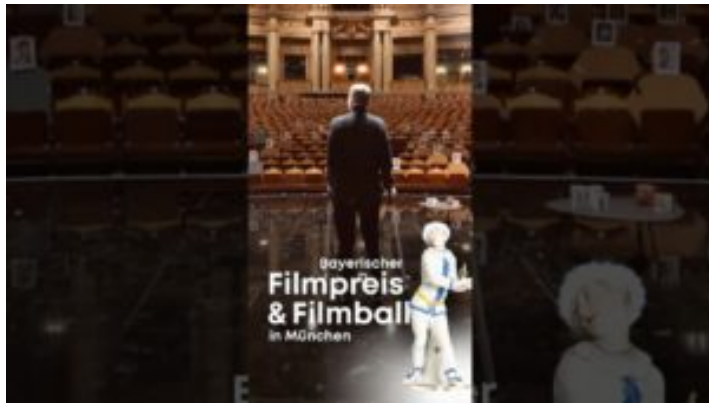
47. Bayerischer Filmpreis und 50. Deutscher Filmball – ...