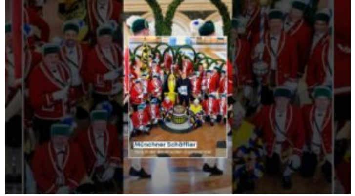
Münchner Schaffler in der Bayerischen Staatskanzlei – ...