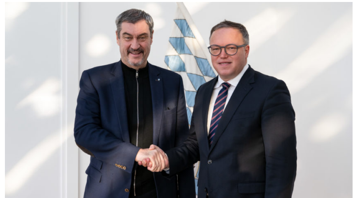
Gespräch mit Thüringens Ministerpräsident Mario Voigt