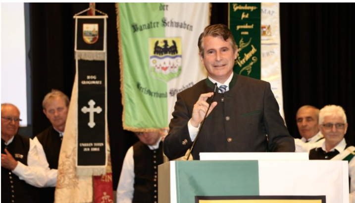
Heimattag der Landsmannschaft der Banater Schwaben