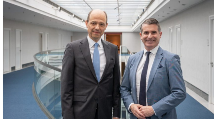
Staatsminister Beißwenger in Kasachstan und Usbekistan