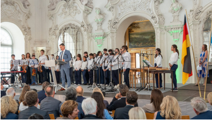
Empfang zum italienischen Nationalfeiertag