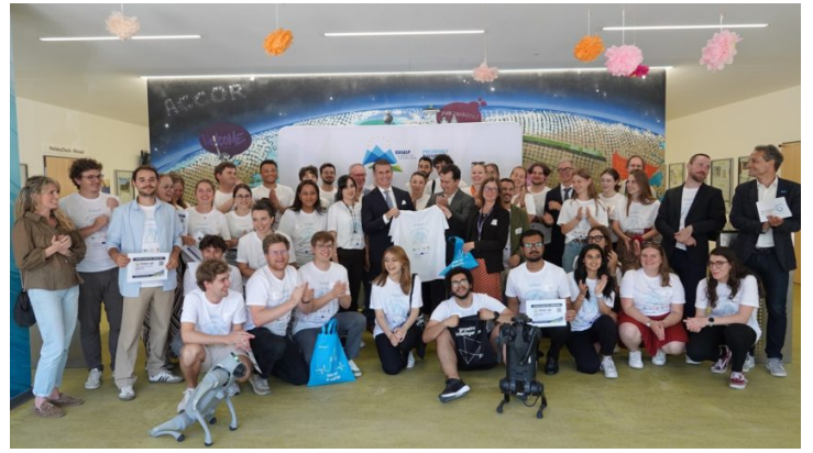
EUSALP AI Hackathon