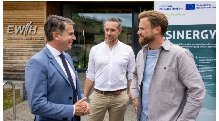
Besuch beim Elektrizitätswerk Hindelang eG