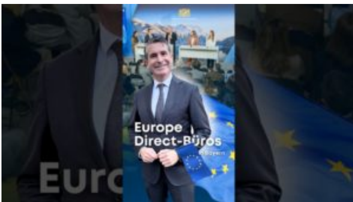
Europe Direct-Büros – Bayern