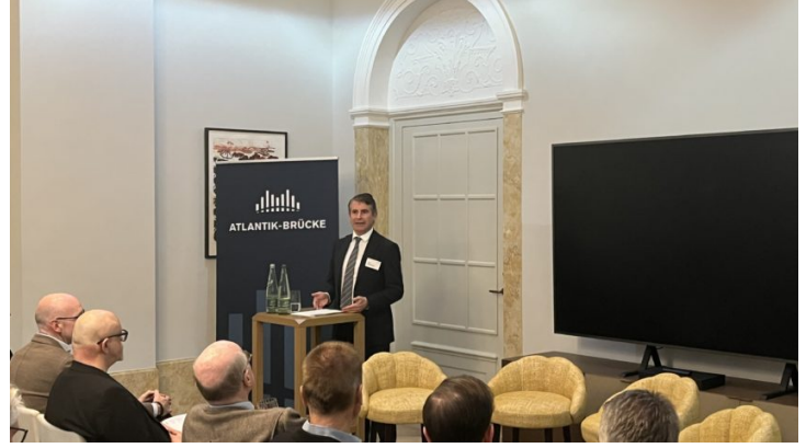
Atlantik-Brücke: Nachlese zur Münchner Sicherheitskonferenz ...