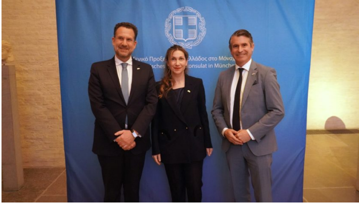
Empfang zum griechischen Nationalfeiertag