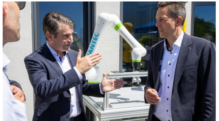
Allgäuer Robotik Tag 2026 der QUANTEC Engineering GmbH