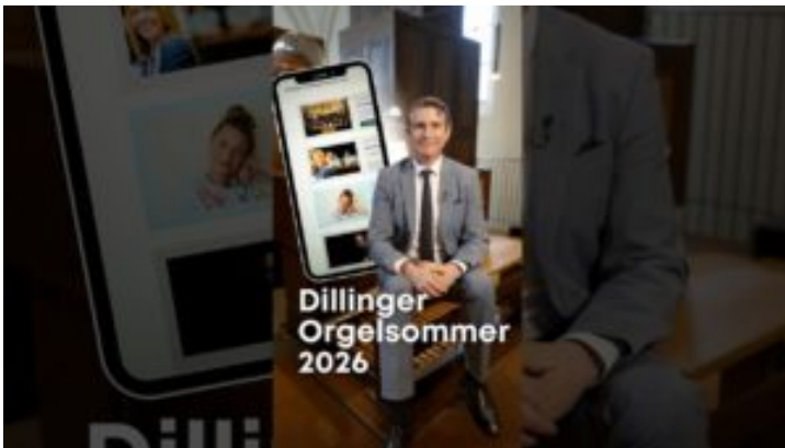
Dillinger Basilikakonzerte – Bayern