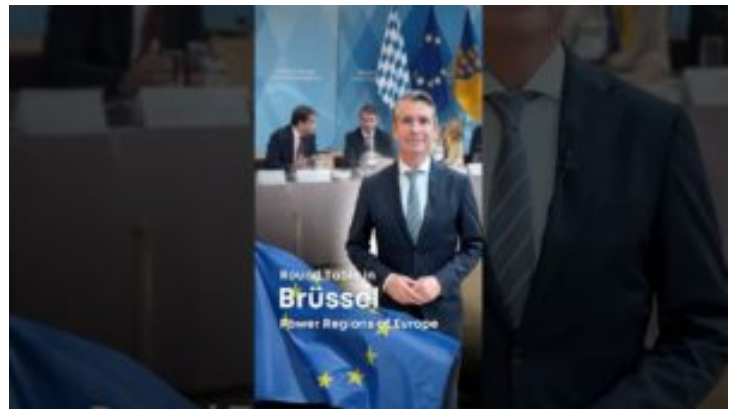
„Power Regions of Europe“ – Forderungen an Brüssel – ...