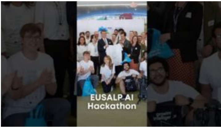
EUSALP AI Hackathon - Bayern