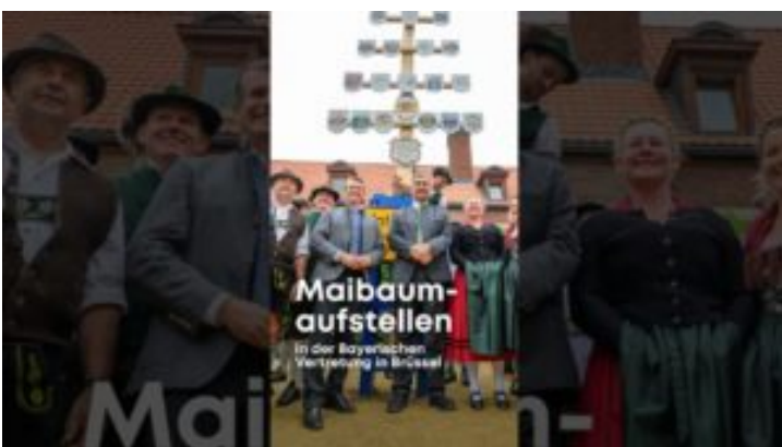
Maibaumaufstellen in der Bayerischen Vertretung in Brüssel ...