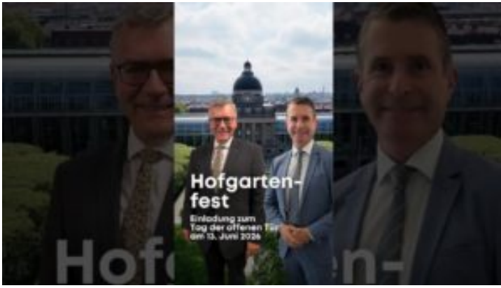
Hofgartenfest und Tag der offenen Tür am 13. Juni 2026 - ...