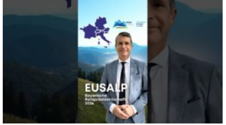
EUSALP – Bayern