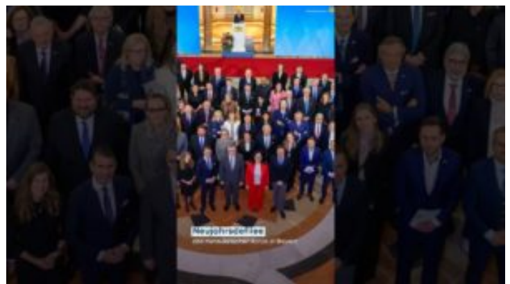
Empfang für das Konsularische Korps 2026 – Bayern