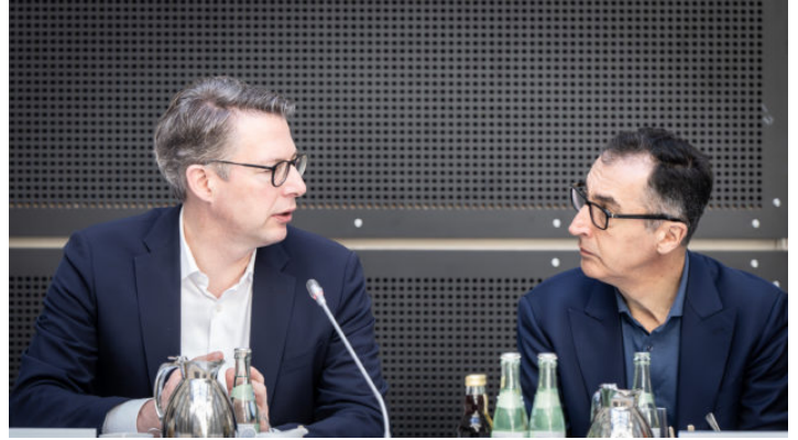
Wissenschaftsminister Markus Blume empfängt Gemeinsame Wissenschaftskonferenz ...