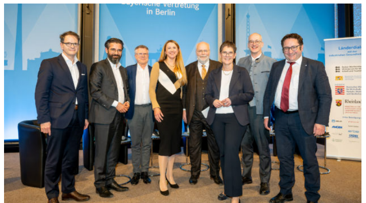
Länder-Dialog industrielle Gesundheitswirtschaft mit Wirtschaftsstaatssekretär ...