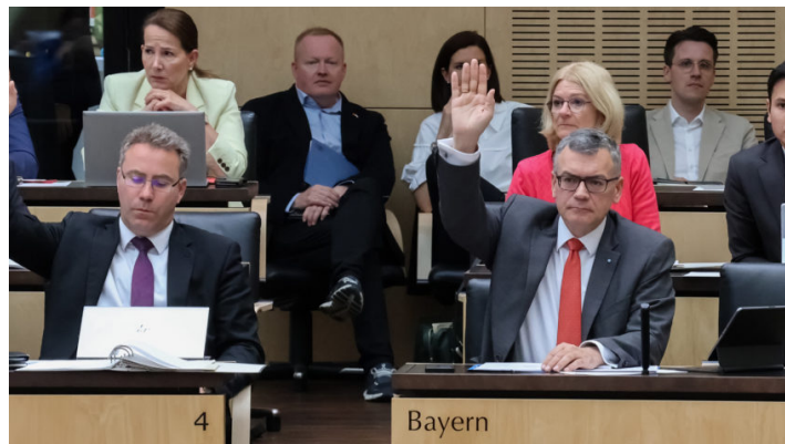
Sitzung des Bundesrates am 17. Mai 2024

Bayerische Initiativen zu überflüssiger Bürokratie bei Datenschutz und im Bereich von Land- und Forstwirtschaft im Bundesrat erfolgreich / Vorstellung bayerischer Initiativen „Strafrechtlicher Schutz von Persönlichkeitsrechten vor Deepfakes“ und „Anspruchseinschränkung nach dem Asylbewerberleistungsgesetz bei Ausreisepflicht“