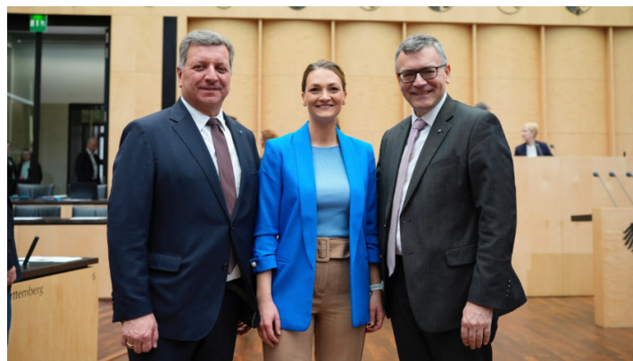
Sitzung des Bundesrates am 22. März 2024

Erfolgreiche bayerische Initiativen zur Arzneimittelversorgung, Mobilfunkförderung und Stärkung des Bevölkerungsschutzes / Justizminister Eisenreich stellt Initiative zum Datenschutz vor