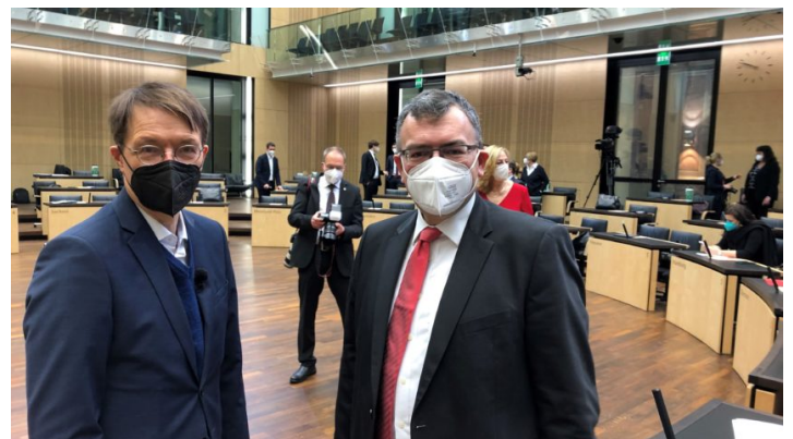
Sitzung des Bundesrates am 14. Januar 2022

Antrittsrede von Bundeskanzler Scholz im Bundesrat / Bayern bringt Initiativen u.a. zu Wohnungsbau ein