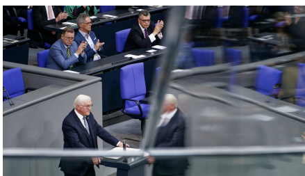
Staatsminister Dr. Florian Herrmann auf der Länderbank im Deutschen Bundestag anlässlich einer Gedenkstunde zum Aufstand am 17. Juni 1953 (im Vordergrund: Bundespräsident Steinmeier).

Ausgehend vom Bundesrat als Länderkammer begleitet die Vertretung schwerpunktmäßig die Gesetzgebung des Bundes. Jedes Bayerische Staatsministerium entsendet eine Verbindungsreferentin bzw. einen Verbindungsreferenten zur Beobachtung der Politikthemen des jeweiligen Ressorts in Berlin.