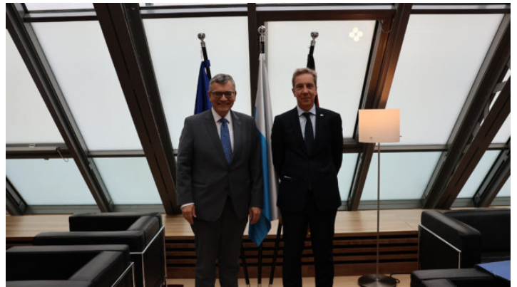
Besuch des Botschafters von Griechenland