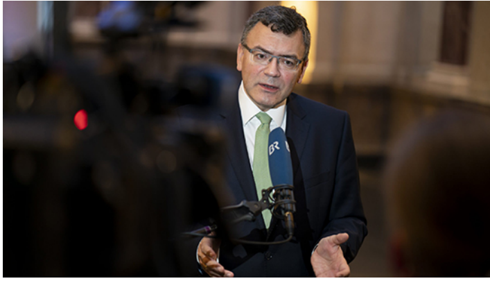
Sitzung des Bundesrates am 6. November 2020