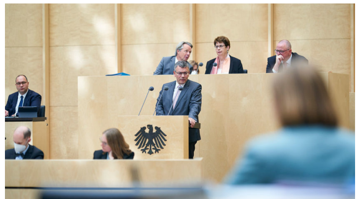
Sitzung des Bundesrates am 16. September 2022