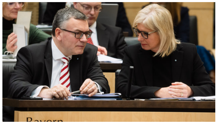
Sitzung des Bundesrates am 2. Februar 2024

Bayerische Initiativen u.a. zur Eindämmung der illegalen Migration / Ablehnung der Kürzungen beim Agrardiesel / Weiterentwicklung Bürgergeld / Modernisierung Staatsangehörigkeitsrecht und Rückführungsverbesserungsgesetz