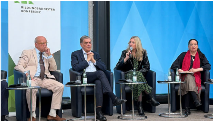
Staatsministerin Stolz bei Fachtagung zu Strategien gegen Antiziganismus ...