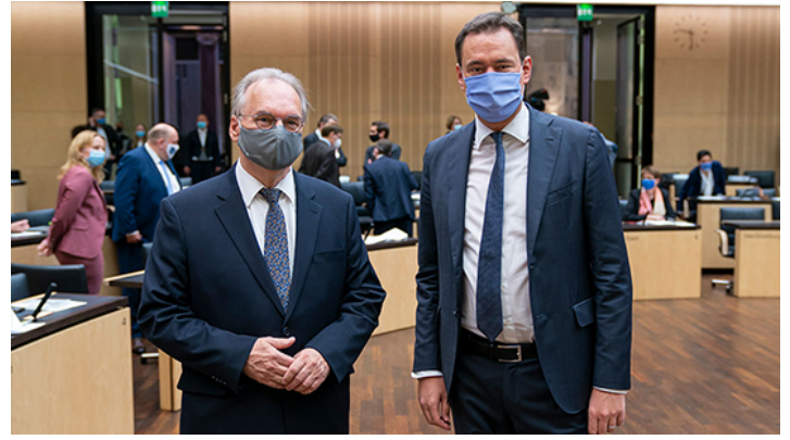
Sitzung des Bundesrates am 9. Oktober 2020

Kampf gegen Corona-Pandemie: Bundesratsminister Dr. Herrmann stellt bayerische Initiative vor