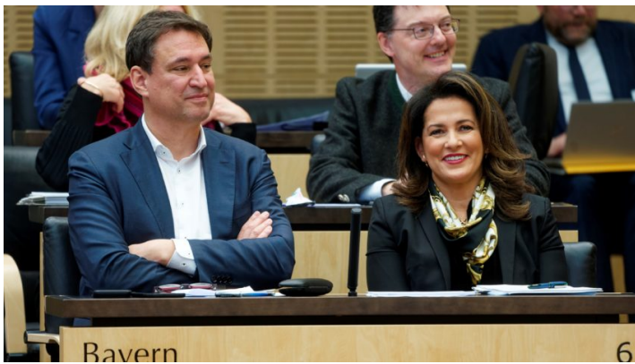
Sitzung des Bundesrates am 15. Dezember 2023

Bayerische Initiativen u.a. zur Eindämmung der illegalen Migration / Ablehnung der Kürzungen beim Agrardiesel / Weiterentwicklung Bürgergeld / Modernisierung Staatsangehörigkeitsrecht und Rückführungsverbesserungsgesetz