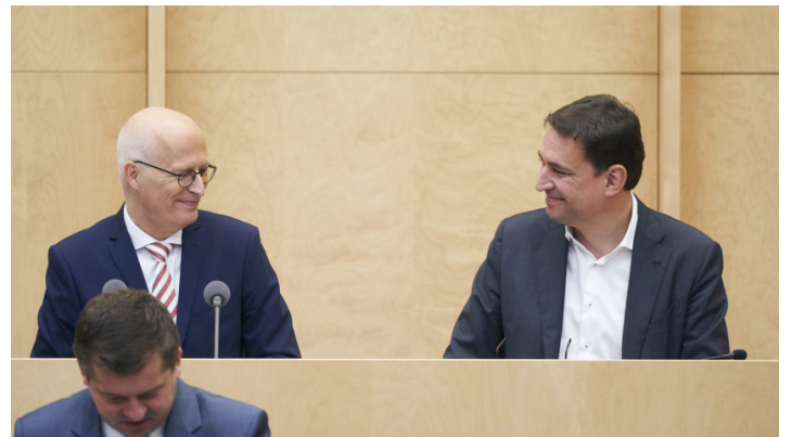
Sitzung des Bundesrates am 28. Oktober 2022

Entlastungspaket III / Bürgergeld / AKW- Laufzeitverlängerung