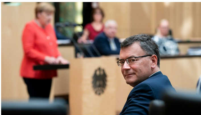
Sitzung des Bundesrates am 3. Juli 2020

Europa, Konjunkturpaket, Kohleausstieg, Grundrente