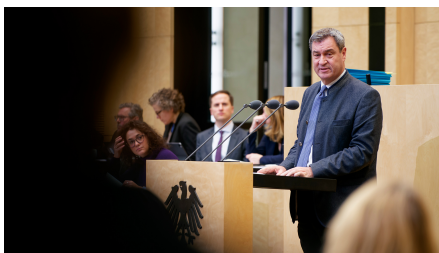
Ministerpräsident Dr. Markus Söder bei einer Rede im Bundesrat.

Ausgehend vom Bundesrat als Länderkammer begleitet die Vertretung schwerpunktmäßig die Gesetzgebung des Bundes. Jedes Bayerische Staatsministerium entsendet eine Verbindungsreferentin bzw. einen Verbindungsreferenten zur Beobachtung der Politikthemen des jeweiligen Ressorts in Berlin.