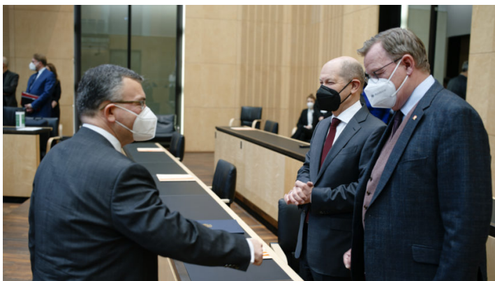
Sitzung des Bundesrates am 11. Februar 2022

Ukraine-Debatte / Bayerische Initiative für ein Sofortprogramm zur Neuausrichtung der Bundeswehr und Reform der Sicherheitsarchitektur / Weitere bayerische Initiativen für eine absolute Energiepreisbremse und zur Bekämpfung der Kinderpornografie