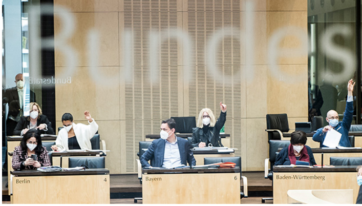
Bundesrat am 5. März 2021