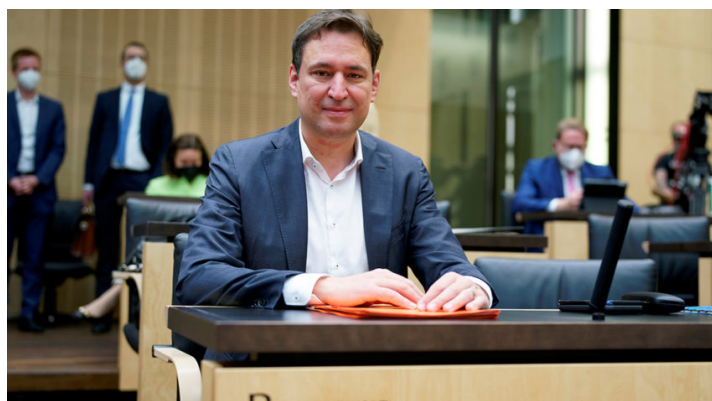
Sitzung des Bundesrates am 11. Mai 2022

Wichtige Entscheidungen für die Bürger / Energiesicherheit und Entlastungen