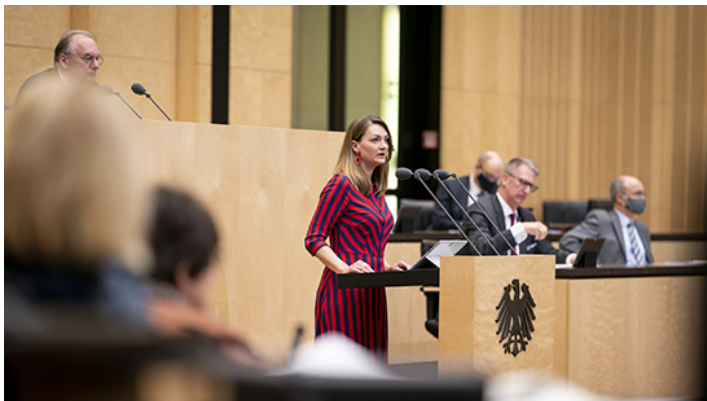
Sitzung des Bundesrates am 27. November 2020

Bundesrat billigt wichtige Gesetze zum Jahresabschluss