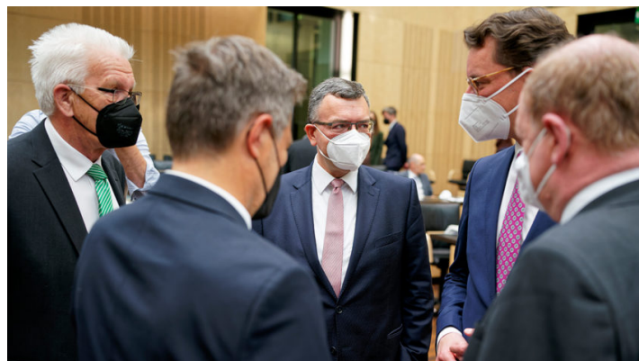
Sitzung des Bundesrates am 20. Mai 2022

Bessere Ausstattung Bundeswehr / Steuerlicher Ausgleich Corona-Folgen