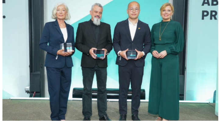
Abend der Pressefreiheit & Verleihung des Pressefreiheitspreises ...