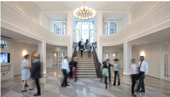
Blick vom Eingang in das Foyer