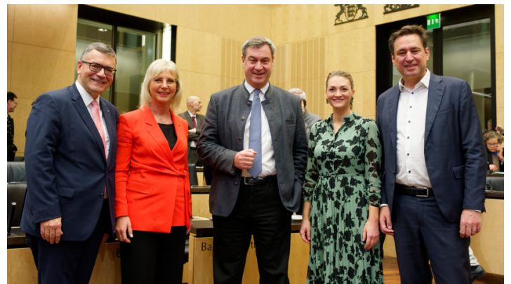
Sitzung des Bundesrates am 24. November 2023

Bayerischer Antrag für dauerhafte Senkung der Gastronomie-Steuer / Wachstumschancengesetz / Kindergrundsicherung / Rückführungsverbesserungsgesetz