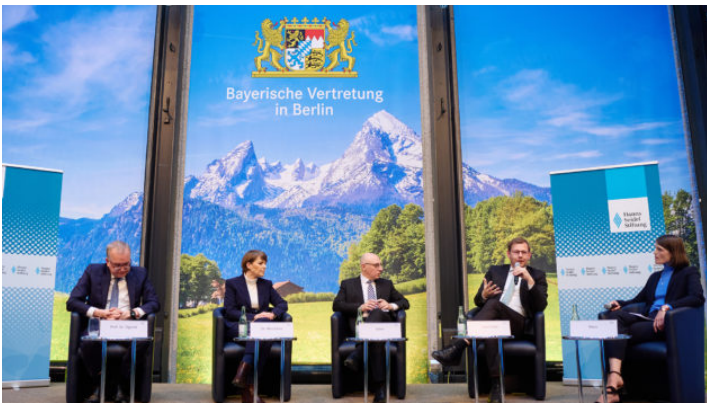
Zwischen Spionage und Sabotage – Sicherheitspolitische Herausforderungen ...