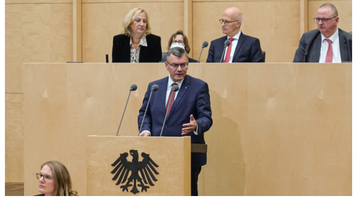
Sondersitzung des Bundesrates am 14. November 2022