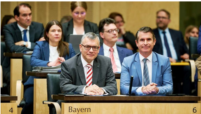
Sitzung des Bundesrates am 8. Mai 2026