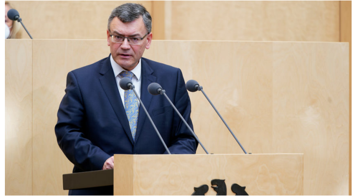
Sitzung des Bundesrates am 11. März 2022

Ukraine-Debatte / Bayerische Initiative für ein Sofortprogramm zur Neuausrichtung der Bundeswehr und Reform der Sicherheitsarchitektur / Weitere bayerische Initiativen für eine absolute Energiepreisbremse und zur Bekämpfung der Kinderpornografie