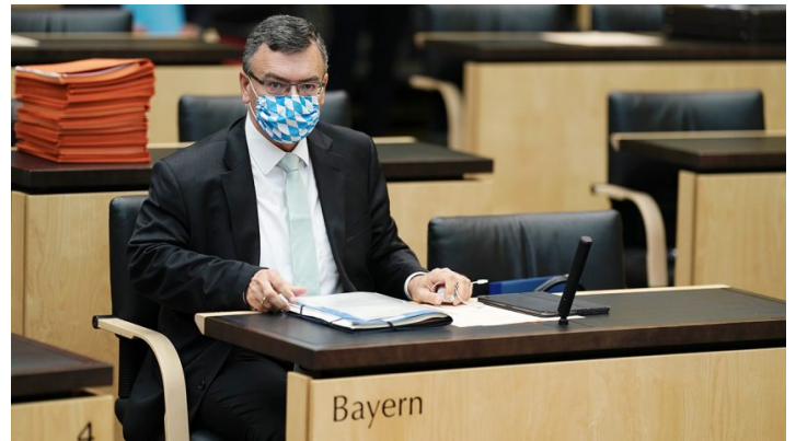
Sitzung des Bundesrates am 18. September 2020