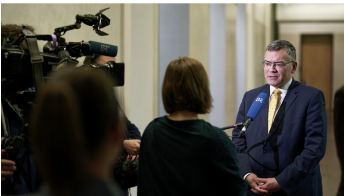
Sitzung des Bundesrates am 7. Oktober 2022

Entlastungspaket III / Bürgergeld / AKW- Laufzeitverlängerung