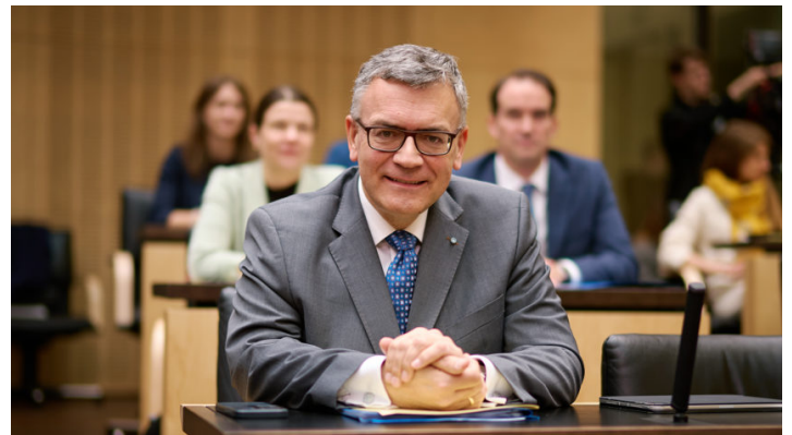
Sondersitzung des Bundesrates am 24. April 2026