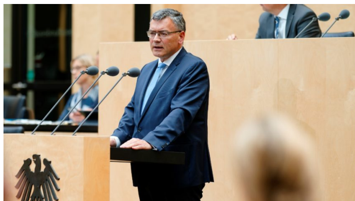
Sitzung des Bundesrates am 8. Juli 2022