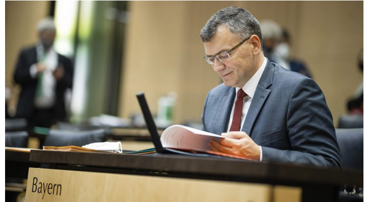
Sitzung des Bundesrates am 18. Dezember 2020

Bundesrat billigt wichtige Gesetze zum Jahresabschluss