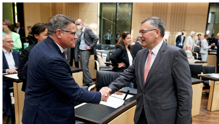
Sitzung des Bundesrates am 10. Juni 2022

Bayern fordert Laufzeitverlängerung der Atomkraftwerke / Bundesrat billigt zentrale energiepolitische Vorhaben