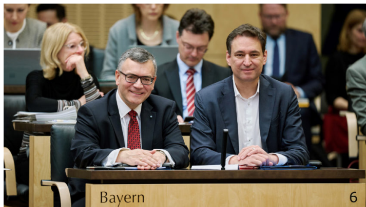
Sitzung des Bundesrates am 26. April 2024

Bayerische Initiativen zu überflüssiger Bürokratie bei Datenschutz und im Bereich von Land- und Forstwirtschaft im Bundesrat erfolgreich / Vorstellung bayerischer Initiativen „Strafrechtlicher Schutz von Persönlichkeitsrechten vor Deepfakes“ und „Anspruchseinschränkung nach dem Asylbewerberleistungsgesetz bei Ausreisepflicht“