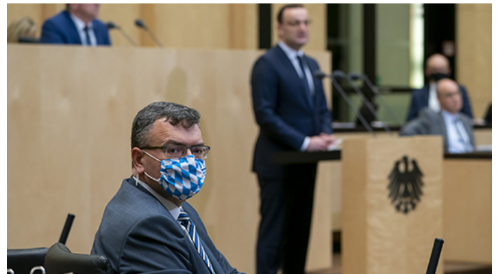
Sondersitzung des Bundesrates am 18. November 2020 zur Corona-Pandemie

Zwei bayerische Bundesratsinitiativen beschlossen