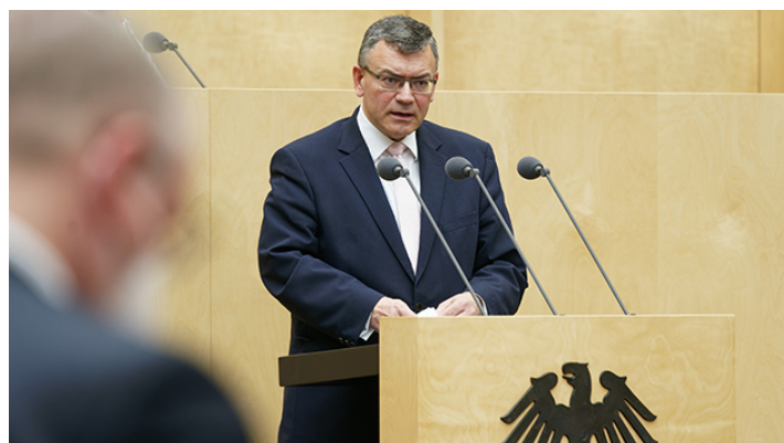
Sitzung des Bundesrates am 08. April 2022