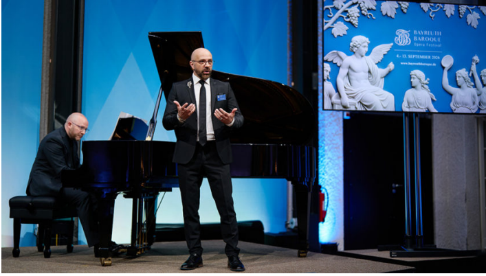
Bayreuth Baroque – Soiree