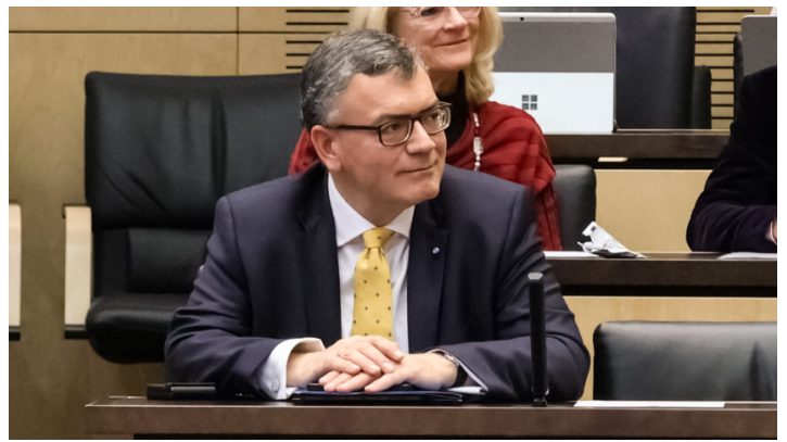
Sitzung des Bundesrates am 7. Dezember 2023

Nachtragshaushalt 2023 / Bayerische Initiativen u.a. Weiterentwicklung Bürgergeld, Schutz der bäuerlichen Rinderhaltung, Schutz der Weidetierhaltung vor wachsender Wolfspopulation, rechtssichere Bezahlkarte für Asylbewerber