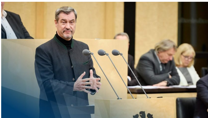
Ministerpräsident Dr. Markus Söder: „Historische Entscheidung im Bundesrat: Deutschland ist wieder da.“