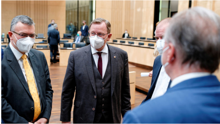
Sondersitzung des Bundesrates am 18. März 2022

Bessere Ausstattung der Bundeswehr / Steuerentlastungen angesichts gestiegener Verbraucherpreise / Bayerische EntschlieÙung für die stärkere Nutzung der Potenziale von Recycling- Baustoffen