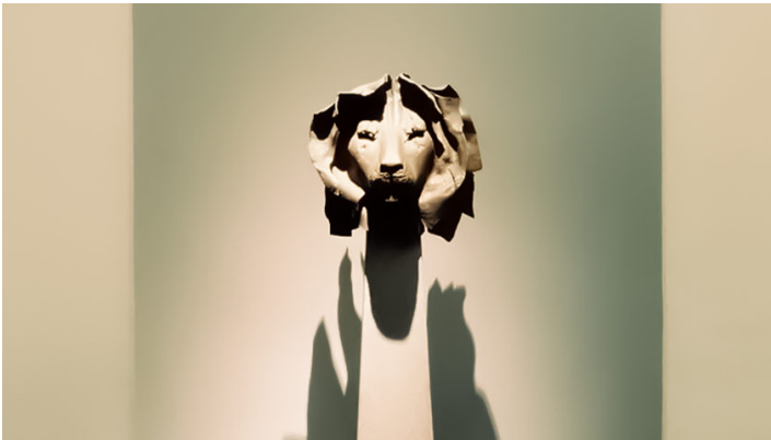
Löwenkopf von Hubertus von Pilgrim