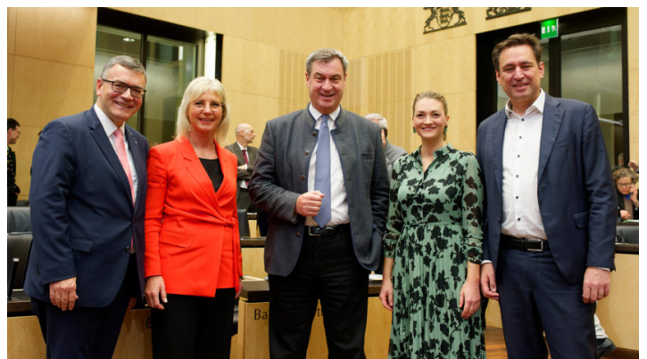
Sitzung des Bundesrates am 24. November 2023