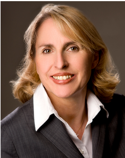
Porträt: Staatsrätin Karolina Gernbauer

An der Spitze der Vertretung steht Staatsrätin Karolina Gernbauer als Bevollmächtigte des Freistaates Bayern beim Bund .