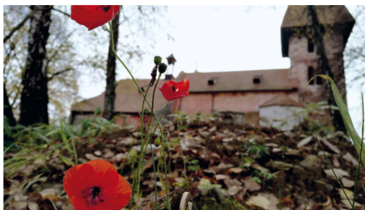
Výstava „Vybledlé, ale ne ztracené“