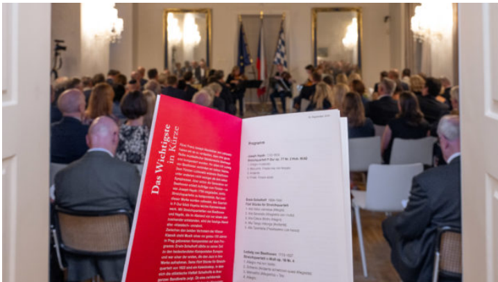
Koncert smyčcového kvarteta Berganza Bamberských symfoniků ...