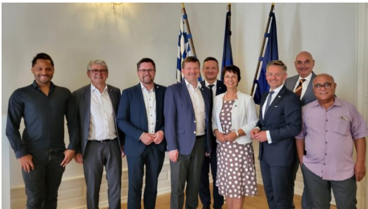
Návštěva Evropského výboru Bavorského zemského sněmu ...