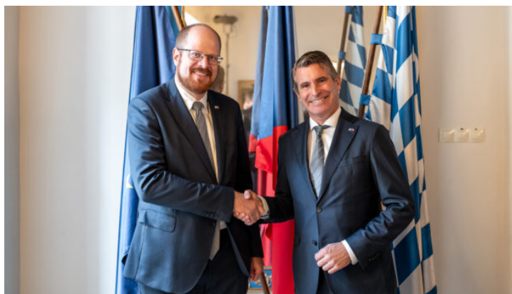
Slavnostní akt u příležitosti 10 let Bavorského zastoupení ...