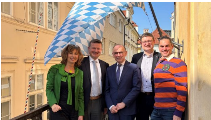
Výběrový pohovor na stáž v Bavorském zemském sněmu (BayPP) ...

Zastoupení Svobodného státu Bavorsko v České republice prohlubuje vztahy Bavorska s vládou České republiky, s českou občanskou společností a se zástupci hospodářství, a to prostřednictvím společných projektů a akcí, ale i jako „vizitka Bavorska“ v České republice.