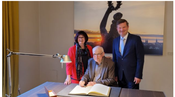
Vernisáž výstavy „Čechy neleží u moře“ na ...