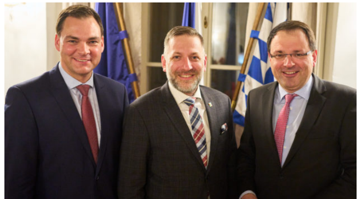
Česko-bavorská spolupráce v příhraničí