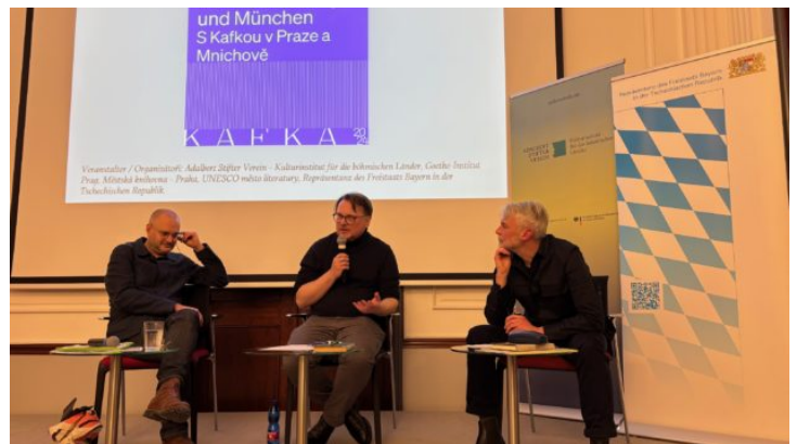
S Kafkou v Praze a Mnichově