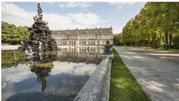
Bavorsko z pohodlí domova: Prohlídka zámku Herrenchiemsee