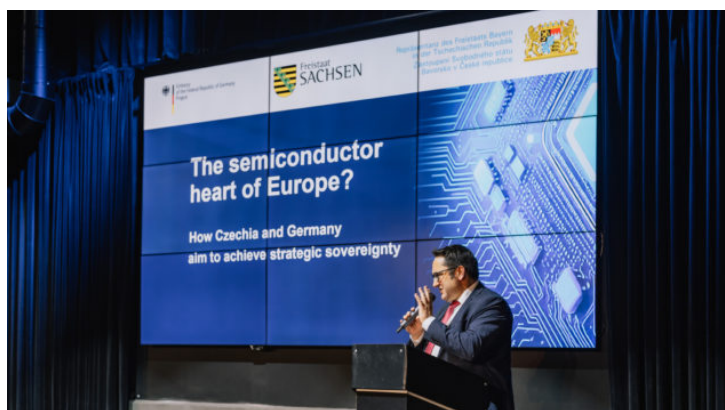
Inovační dny 2024