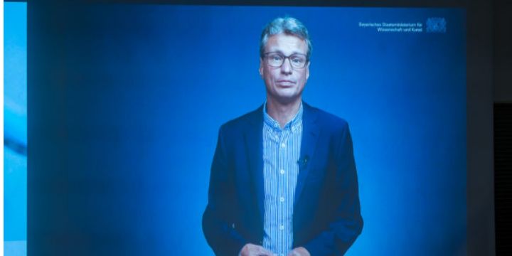
„Pathways into Sustainable Future“: Konference o zelených ...