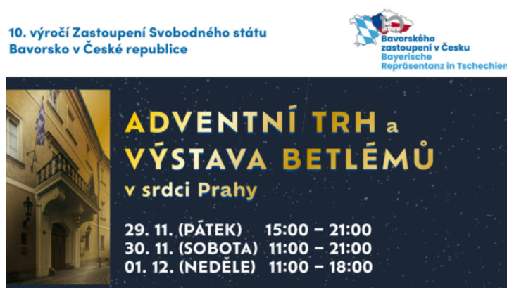
Adventní trh a výstava českých a bavorských betlémů