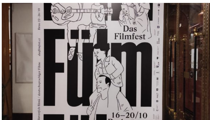
Festival německy mluvených filmů Das FILMFEST