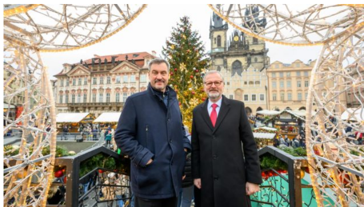
Ministerský předseda Dr. Söder v Praze