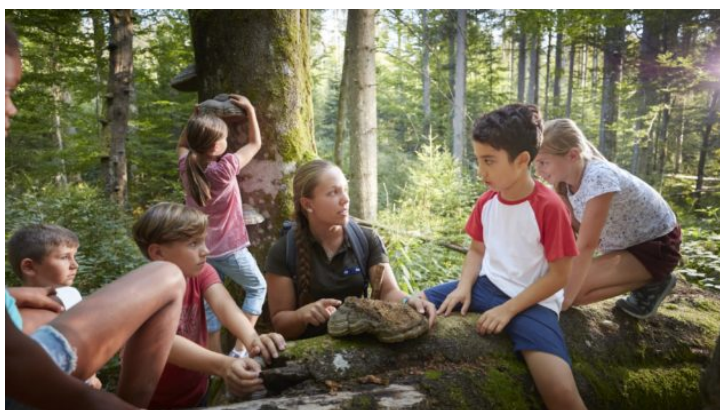
Bavorsko z pohodlí domova: Procházka po Národním parku Bavorský ...