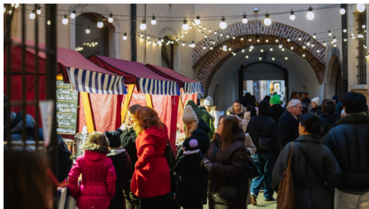
Adventní trh u příležitosti 10 let Bavorského zastoupení ...