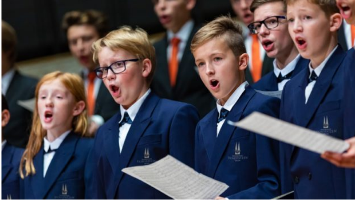
Turné sboru Regensburger Domspatzen v Česku – 10 let ...