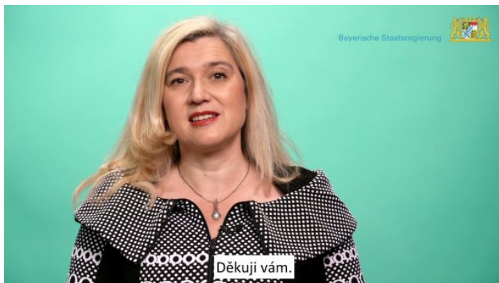
Bavorsko z pohodlí domova: Úvodní slovo bavorské ministryně ...