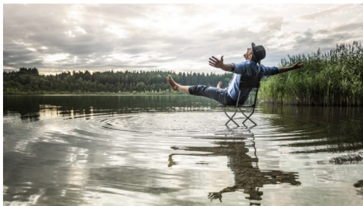
Bavorsko sedmkrát jinak: Dobijte si baterie