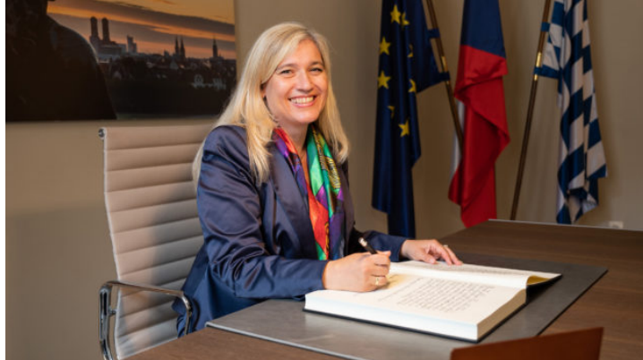
Bavorská ministryně Melanie Huml v Praze