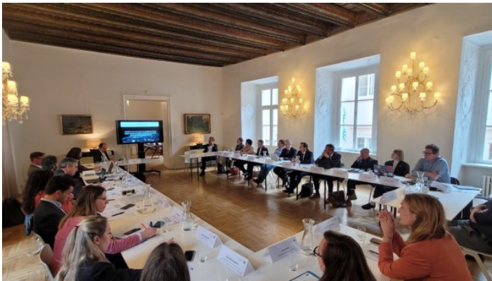
Odborná diskuze s agenturou EUSPA