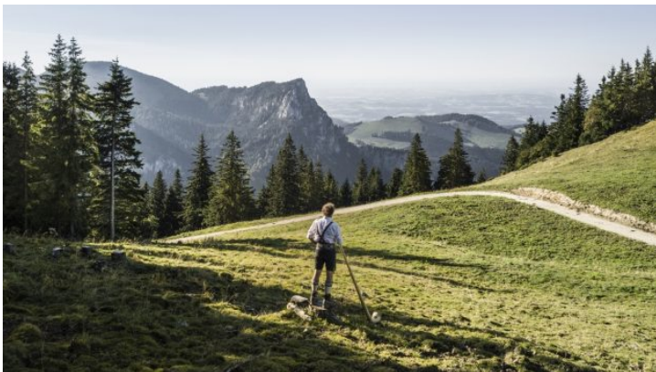
Vom Sofa nach Bayern: Alphornkonzert