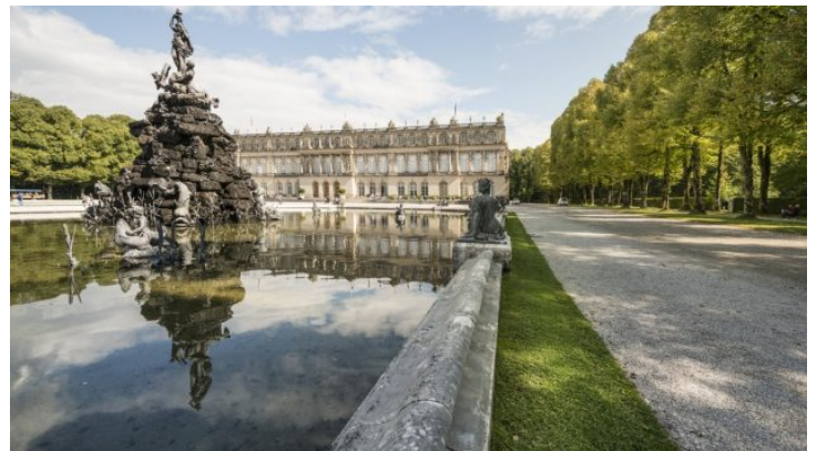
Vom Sofa nach Bayern: Führung durch das Schloss Herrenchiemsee ...