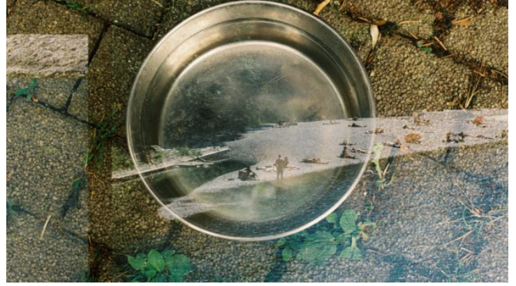
„Auf den zweiten Blick | Na druhý pohled“ Ein Fotoaustausch ...