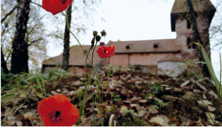
Ausstellung „Verblichen, aber nicht verschwunden“