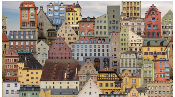
Verwandelte Fotos – Ausstellung der Künstlerin Lena Schabus ...