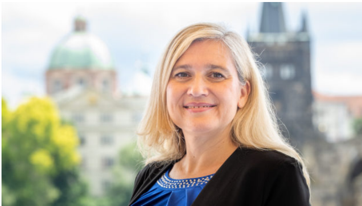
Europaministerin Huml in Prag