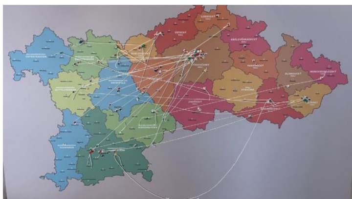
Zweites bayerisch-tschechisches Lehrer-Netzwerktreffen