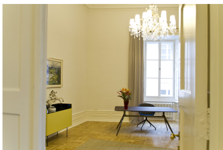
Räumlichkeiten der Bayerischen Repräsentanz in Prag.

Die Repräsentanz des Freistaats Bayern in Tschechien gewährt Besuchergruppen gerne Einblick in ihre Arbeit vor Ort.