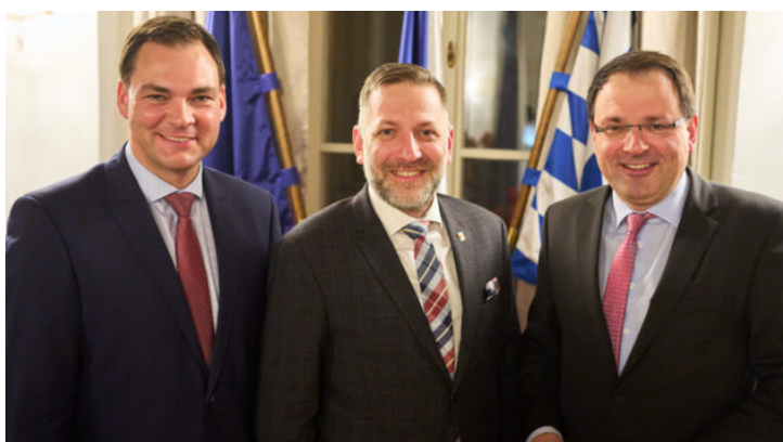
Bayerisch-tschechische Zusammenarbeit in der Grenzregion