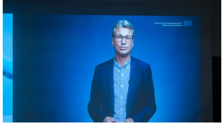
„Pathways into a Sustainable Future“: Konferenz zu grünen ...