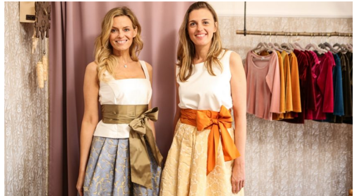
Und du so? Bayern und Tschechien im grenzenlosen Kultur-Austausch