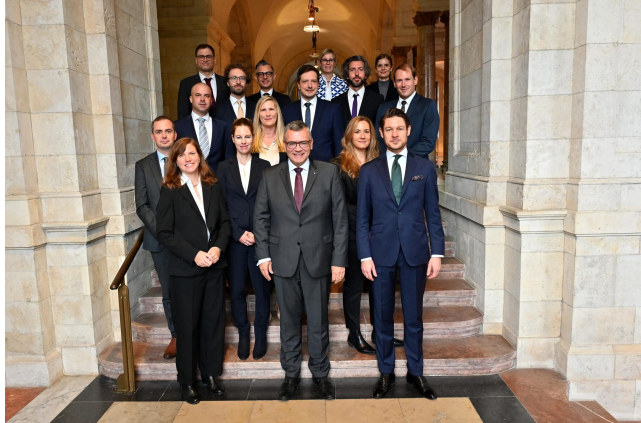
29. Corso di formazione in gestione amministrativa.