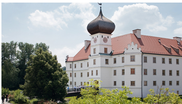
Schloss Hohenkammer.

Il seminario internazionale Hohenkammer viene organizzato ogni due anni dalla Cancelleria di Stato bavarese in collaborazione con il Consolato Generale degli Stati Uniti d'America e un altro Paese ospite. Presenta relatori rinomati e tratta temi attuali e transnazionali. L'obiettivo è promuovere la competenza internazionale dell'amministrazione ministeriale bavarese. La lingua di lavoro è quindi l'inglese.