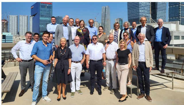
Gruppe des X.TOP Management Programms beim Besuch des ARD-Studios in Tel Aviv.