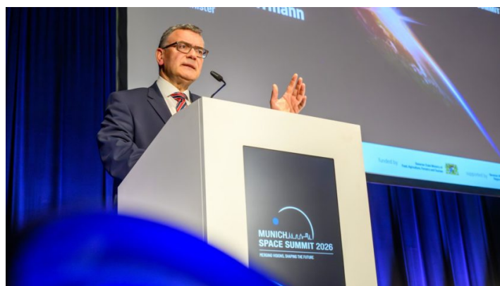
Munich Space Summit 2026