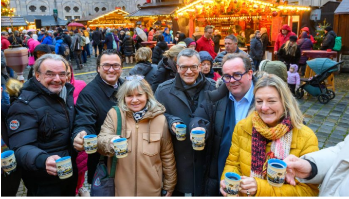
Eröffnung des Weihnachtsdorfs im Kaiserhof der Münchner Residenz ...