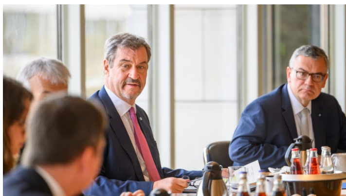
Kabinettsitzung am 24. März 2026