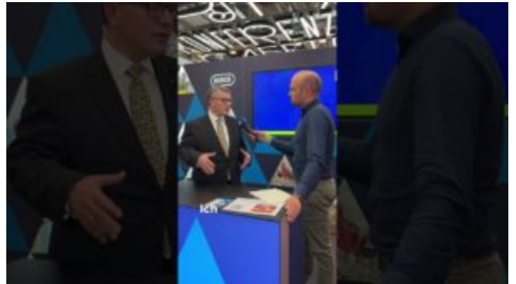
#MTM Besuch der Medientage München - Bayern