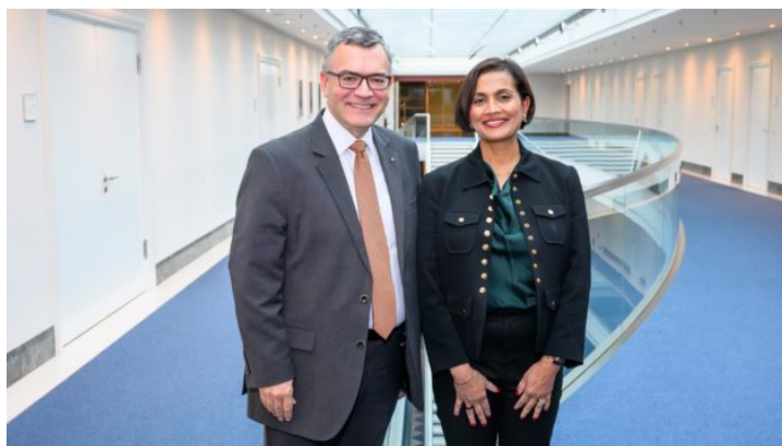
Gespräch mit Executive Vice President bei Cisco Systems GmbH, ...