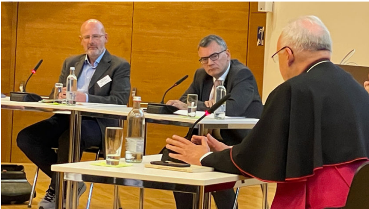
Symposium „100 Jahre Bayerisches Konkordat“