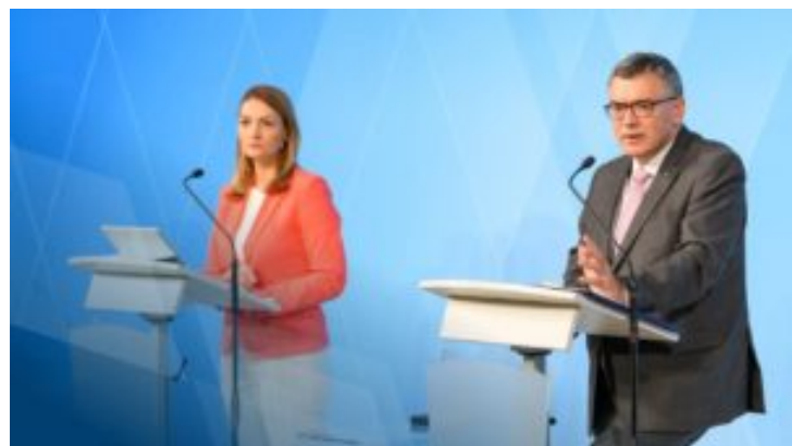
Video in Gebärdensprache: Pressekonferenz nach der Kabinettsitzung ...