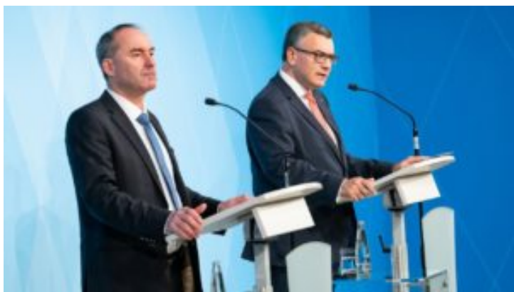
Video in Gebärdensprache: Pressekonferenz nach dem Kabinett ...