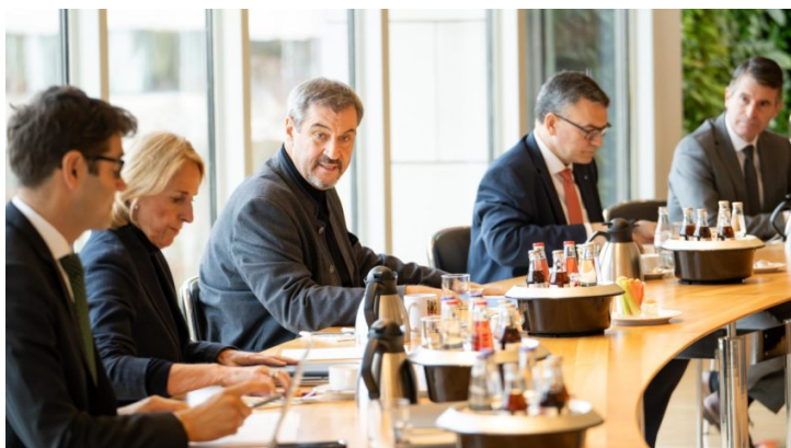
Kabinettsitzung am 19. November 2024