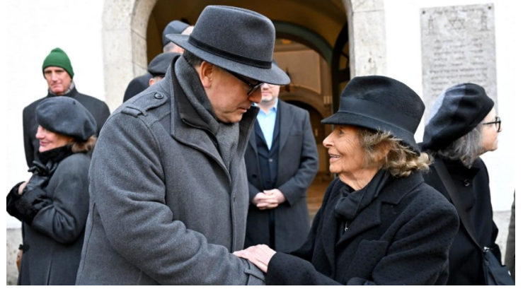
Volkstrauertag: Kranzniederlegung der Israelitischen Kultusgemeinde ...