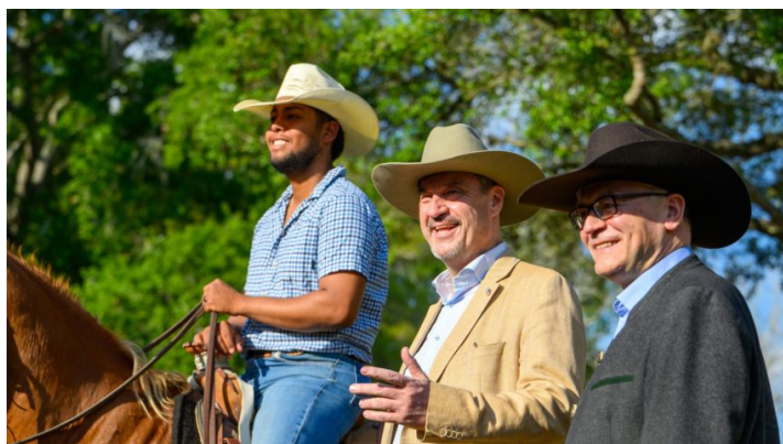
Reise nach Texas und South Carolina