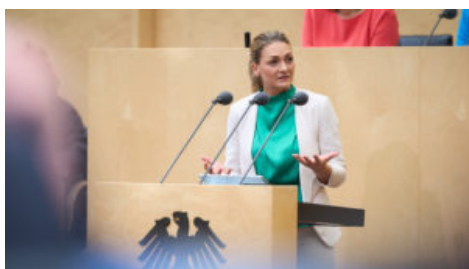
Bayerns Gesundheitsministerin Judith Gerlach, MdL.

Bayerns Gesundheitsministerin Judith Gerlach kritisierte nachdrücklich die geplante Krankenhausreform der Bundesregierung. Bayern befürchtet eine deutlich reduzierte Angebotspalette der Krankenhäuser, insb. in der Fläche .