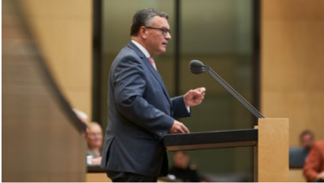
Staatsminister Dr. Florian Herrmann, MdL.

Der Bundesrat ließ das Gebäudeenergiegesetz passieren, ein bayerischer Antrag auf Anrufung des Vermittlungsausschusses scheiterte im Plenum. Das Gesetz sieht vor, dass ab 2024 in neue Gebäude in Neubaugebieten nur noch zu 65 Prozent mit erneuerbaren Energien betriebene Heizungen eingebaut werden dürfen. Für Bestandsbauten und Neubauten außerhalb von Neubaugebieten gilt die 65-Prozent-Regelung je nach Vorliegen einer kommunalen Wärmeplanung spätestens ab dem 1. Juli 2028.